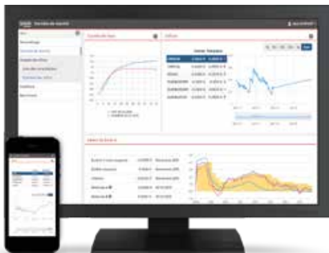
Données de marchés